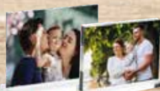
Metacrilatos con peana