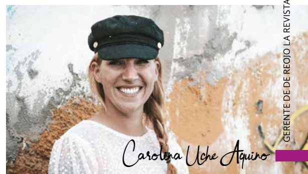
GERENTE DE DE REOJO LA REVISTA Y DE PCL RADIO