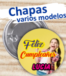
Chapas varios modelos