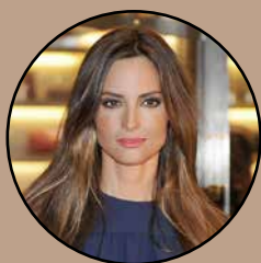
Ariadne Artiles. Premio Influencia